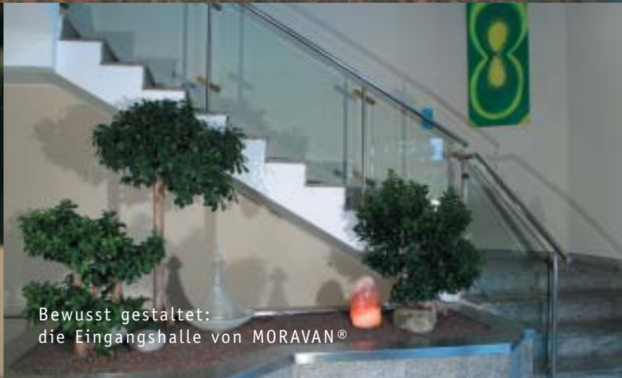
Bewusst gestaltet: die Eingangshalle von MORAVAN®