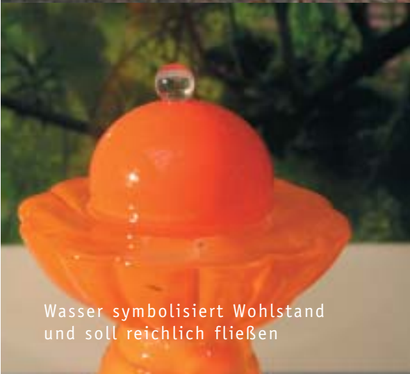
Wasser symbolisiert Wohlstand und soll reichlich fließen