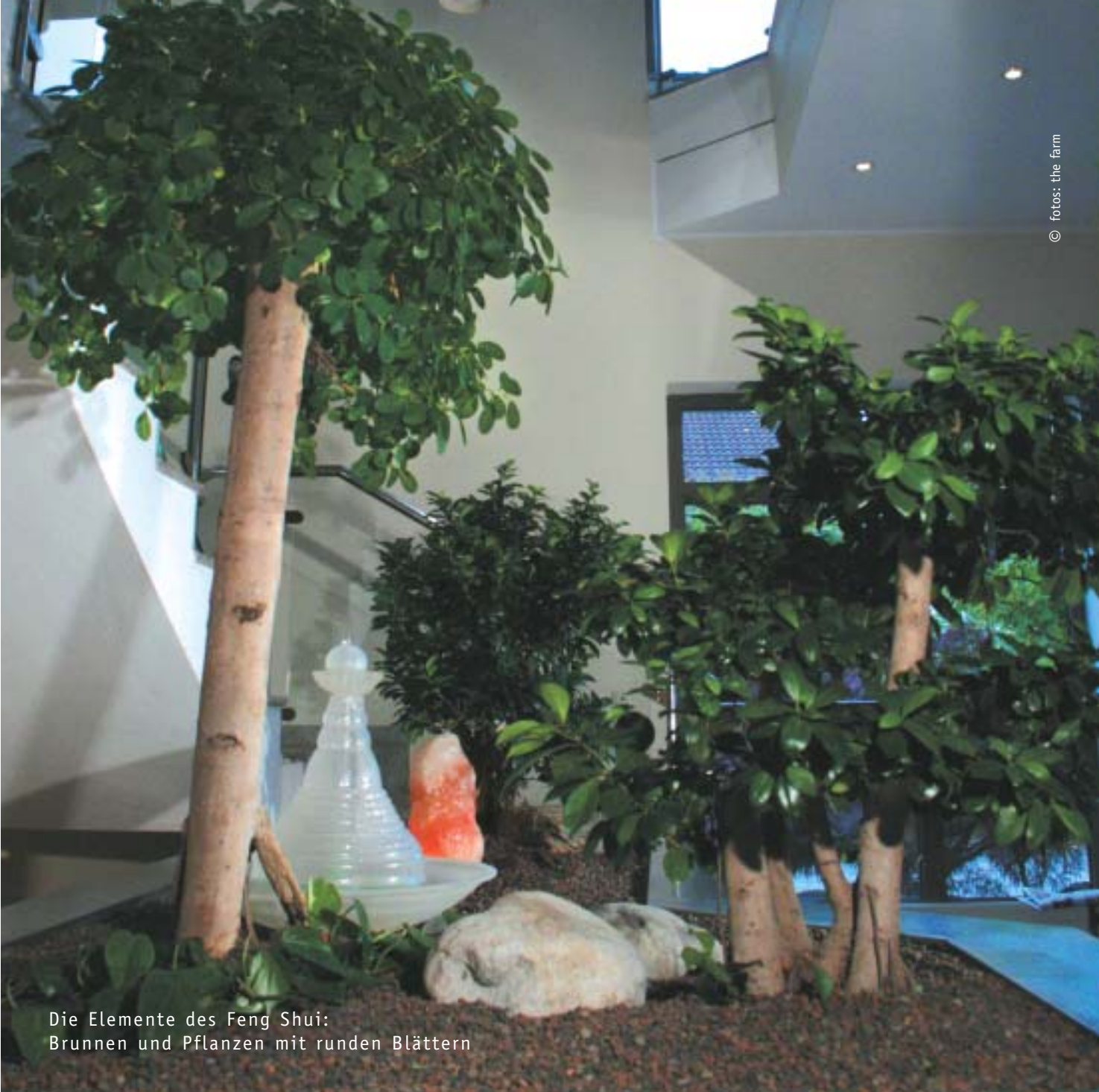
Die Elemente des Feng Shui: Brunnen und Pflanzen mit runden Blättern